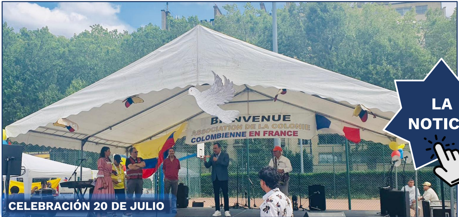
CELEBRACIÓN 20 DE JULIO